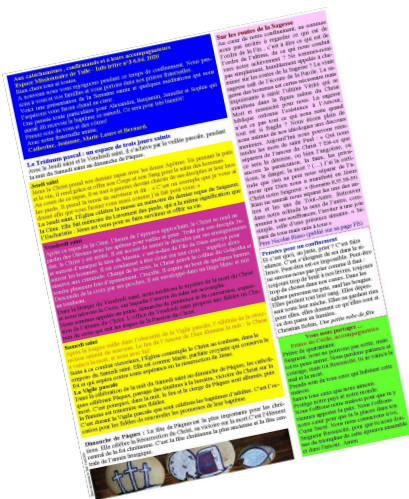
Une info lettre est envoyée régulièrement aux adultes qui se préparent au baptême ou à la confirmation.