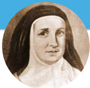
Mère Thérèse de Jésus

Chaque mois, découvrez une figure marquante de Corrèze