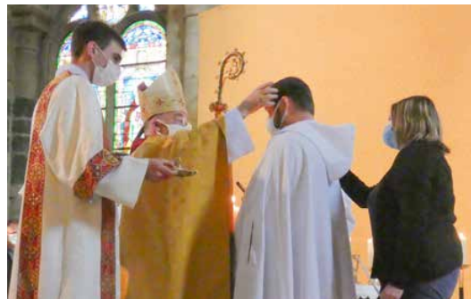
▲ Confirmations d'adultes lors de la Vigile Pascale de 2021

Ce que je viens de dire pour ceux qui reçoivent la Confirmation, je peux le dire aussi pour mon ministère épiscopal. Qu'est-ce qui fait que je suis évêque ? Le don de l'Esprit-Saint au jour de mon ordination épiscopale ! C'est le pape qui nomme les évêques, et c'est l'Esprit-Saint qui les fait ! L'évêque élu (choisi, nommé) est consacré par l'imposition des mains des évêques consécrateurs et la prière d'ordination qui lui confèrent le don de l'Esprit-Saint pour qu'il puisse accomplir son ministère. Je fais l'expérience chaque jour que sans l'action de l'Esprit Saint mon ministère ne serait pas possible ou qu'il serait stérile. Voilà