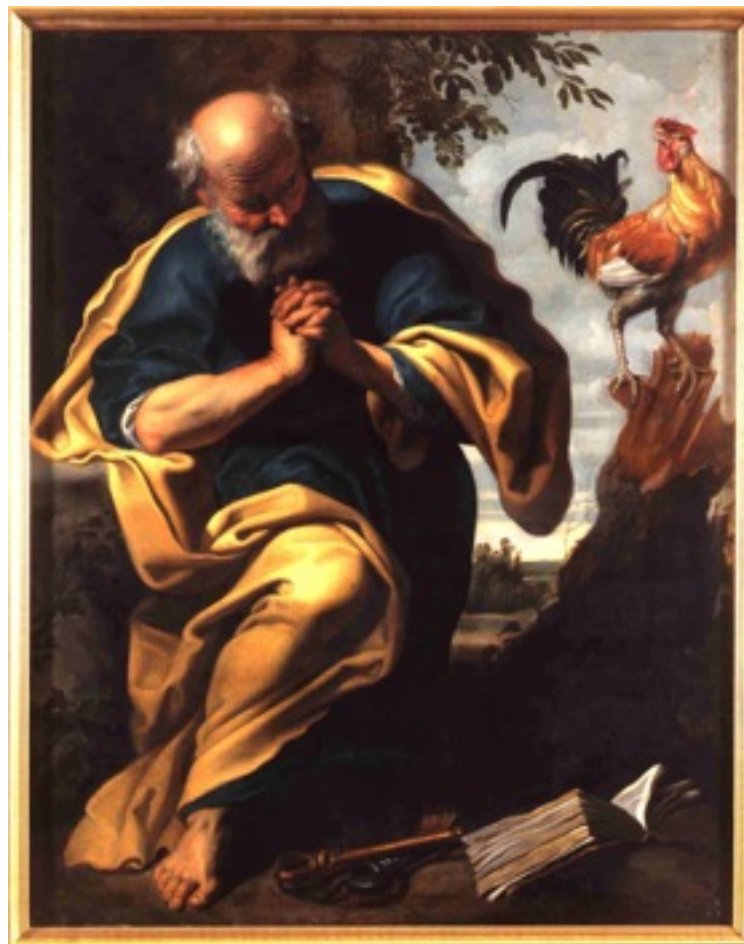
Renement de St Pierre, G. SEGHERS, huile sur toile vers 1620, musée B.Arts, Arras.

Jésus déclara : « maintenant le Fils de l'Homme est glorifié, et Dieu est glorifié en lui.(...) là où je vais, vous ne pouvez aller (...) Simon-Pierre lui dit : « Seigneur, où vas tu? » Jésus lui répondit : « Là où je vais tu ne peux pas me suivre maintenant, tu me suivras plus tard ». Pierre lui dit: « Seigneur, pourquoi ne puis-je pas te suivre à présent? je donnerai ma vie pour toi! (...) Amen, Amen, je te le dis : le coq ne chantera pas avant que tu m'aies renié trois fois ».