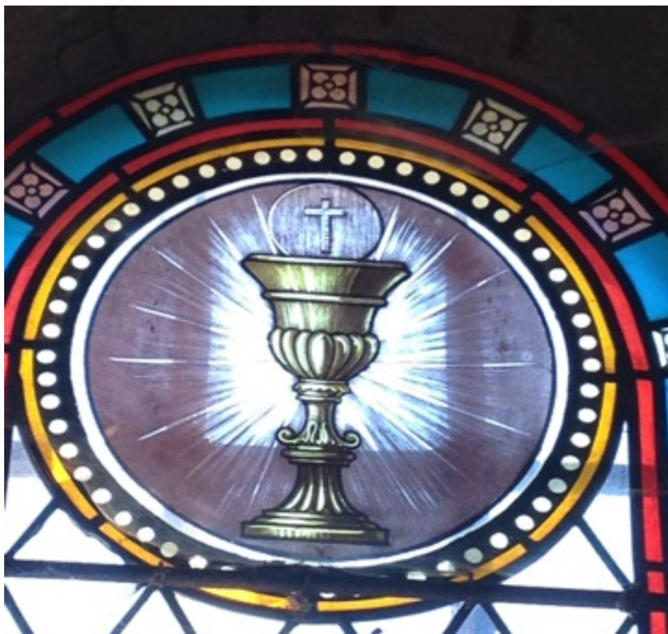
l'Eucharistie, corps et sang du Christ, vitrail de l'église de Blond, Haute Vienne

« la nuit où il était livré, le Seigneur Jésus prit du pain, puis ayant rendu grâce, il le rompit, et dit: « ceci est mon corps, qui est pour vous, faites cela en mémoire de moi. » (...) il fit de même avec la coupe, en disant, : « Cette coupe est la nouvelle Alliance en mon sang,, chaque fois que vous en boirez, faites cela en mémoire de moi. »