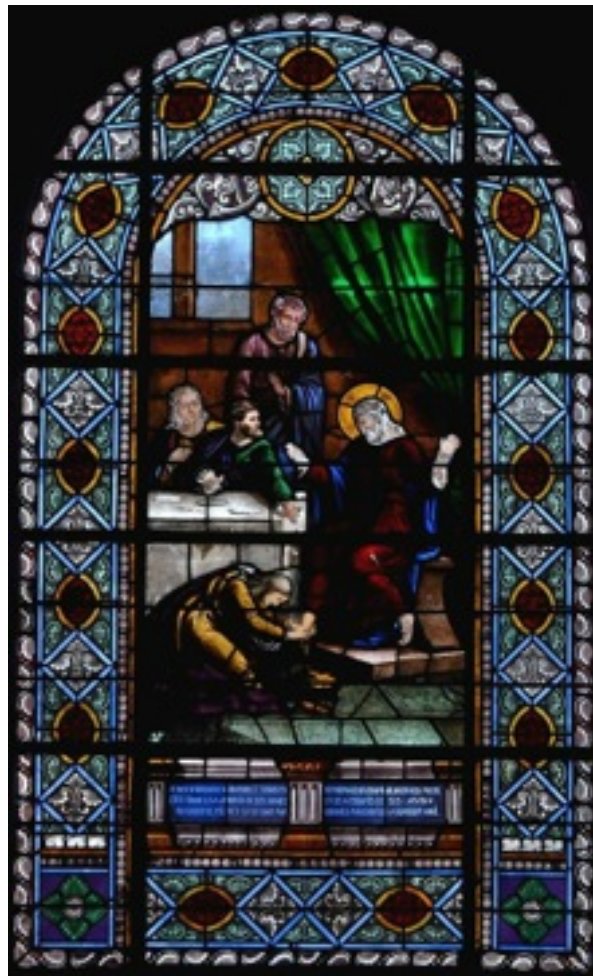
Vitrail, église Ste Croix d'Aubusson (XIX ème siècle)

Six jours avant la Pâque, Jésus vint à Béthanie où habitait Lazare, qu'il avait réveillé d'entre les morts. On donna un repas en l'honneur de Jésus. Marthe faisait le service, Lazare était parmi les convives avec Jésus. Or Marie avait pris une livre de parfum très pur et de très grande valeur; elle répandit le parfum sur les pieds de Jésus, quelle essuya avec ses cheveux.