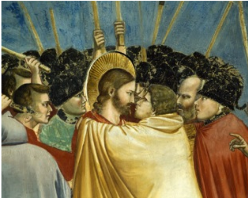
le baiser de Judas, Giotto, début XIVème siècle, Padoue, chapelle Scrovegni.

En ce temps-là, l'un des Douze, nommé Judas Iscariote, se rendit chez les grands prêtres et leur dit: « que voulez vous me donner si je vous livre Jésus ». Ils lui remirent trente pièces d'argent. Et depuis Judas cherchait une occasion favorable pour le livrer ».