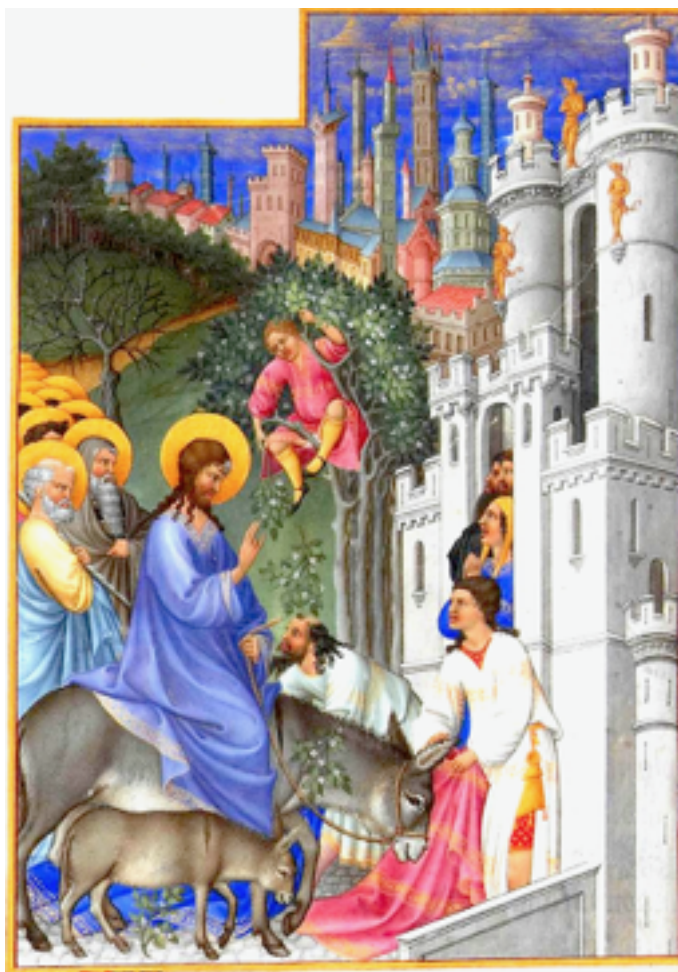
entrée de Jésus à Jérusalem (Manuscrit des Riches Heures du Duc de Berry XVème siècle.

Jésus et ses disciples, approchaient de Jérusalem (...). « allez au village qui est en face de vous; vous trouverez aussitôt une ânesse attachée et son petit avec elle. Détachez-les et amenez-les moi. Et si l'on vous dit quelque chose, vous répondrez : « Le Seigneur en a besoin ». (...) Ils amenèrent l'ânesse et son petit, disposèrent sur eux leurs manteaux, et Jésus s'assit dessus. Dans la foule, la plupart étendirent leurs manteaux sur le chemin ; d'autres coupaient des branches aux arbres et en jonchaient la route. « Hosanna au fils de David! Béni soit celui qui vient au nom du Seigneur! Hosanna au plus haut des cieux ».