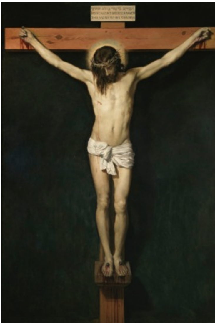
Christ en Croix, Diego Velasquez, 1627, huile sur toile, Musée Prado, Madrid.

« près de la Croix de Jésus se tenait sa mère et la soeur de sa mère, Marie femme de Cléophas, et Marie Madeleine. Jésus, voyant sa mère, et près d'elle le disciple qu'il aimait, dit à sa mère : « Femme, voici ton fils. » Puis il dit au disciple : « Voici ta Mère ». (...) Sachant que tout, désormais, était achevé (...) Jésus dit : « J'ai soif ». IL y avait là un récipient plein d'une boisson vinaigrée. On fixa donc une éponge remplie de ce vinaigre à une branche d'hysope, et on l'approcha de sa bouche. Quand il eut pris le vinaigre, Jésus dit : Tout est accompli. » Puis inclinant la tête, il remit l'esprit.