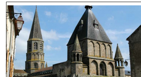
La Collégiale St Pierre du Dorat est l'un des plus beaux édifices romans du Limousin. La flèche de pierre est surmontée d'un ange en cuivre doré du XIII e siècle, appelé « lou Dora » !

Arrivée à 20h10 à Saint Privat, au garage des bus.