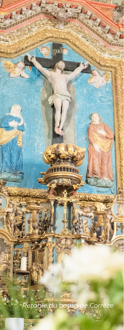
Retable du bourg de Corrèze

Ce guide est édité par le diocèse de Tulle.